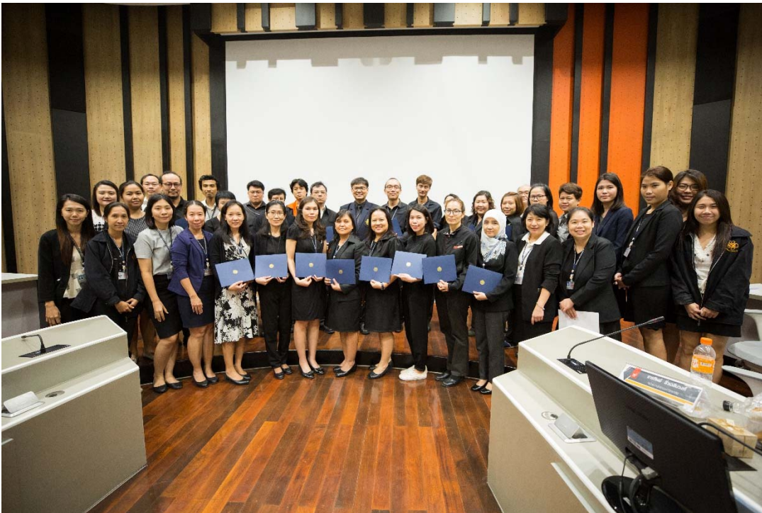
Pic- Senior Leadership

- Executive Leadership เป็นการพัฒนาผู้บริหารระดับสูงให้ได้รับการเสริมศักยภาพทางด้านสมรรถนะผู้นำ (Leadership Skill) ผ่านการประเมินสมรรถนะด้วยเครื่องมือที่ใช้ในระดับโลกเพื่อให้ทราบถึงจุดแข็งและข้อจำกัด แล้วนำผลที่ได้ไปใช้ในการวางแผนการพัฒนาตนเองที่ชัดเจน ดำเนินการระหว่างวันที่ 13 มิถุนายน – 10 กันยายน 2560 มีเข้าร่วมหลักสูตรทั้งสิ้น 8 คน