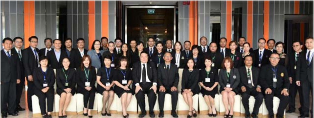
Pic-นบม.รุ่นที่ 28