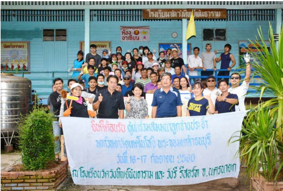
Pic-สัมมนาหลักสูตรประจำ